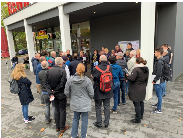
Impression vom Stadtteilspaziergang in Reuschenberg

Die Mitarbeiter des Amtes für Stadtplanung führten in einem insgesamt ca. zweistündigen Rundgang durch die Diskussion. Gestartet wurde auf dem Vorplatz des neuen Nahversorgungszentrums mit REWE-Markt, einer Drogerie und einer Bäckerei mit Café. Die Teilnehmer des Rundgangs berichteten, dass der Nahversorger, auch aufgrund des hohen Durchgangsverkehrs in Reuschenberg, gut angenommen werde. Aber auch für die Einwohner sei der Markt eine Bereicherung. Alle Einkäufe des täglichen Bedarfs können vor Ort erledigt werden. Der namenlose Vorplatz selber biete Raum für die Außengastronomie des Cafés, habe ansonsten aber keine Funktion als Platz. Dies läge an der fehlenden Aufenthaltsqualität aufgrund des Verkehrslärms und der unklaren Aufteilung der Flächen. Beispielsweise würde auch der Anlieferverkehr des Bäckers über die Platzfläche abgewickelt.