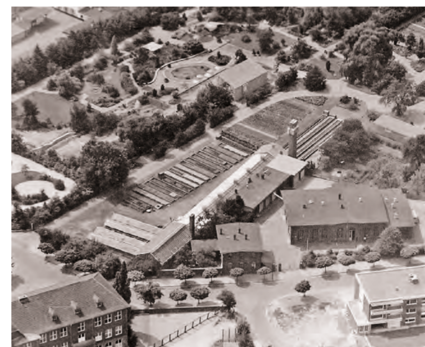
Luftaufnahme des Wasserwerks an der Weingartstraße mit Maschinen- (re.) und Werkmeisterhaus (li.) sowie dem Botanischen Garten, 1964

1986 erwarb die Neusser Bauverein AG die denkmalgeschützten Gebäude und baute sie zu Wohnzwecken im Rahmen des öffentlich geförderten Wohnungsbaus um. Im ehemaligen Pumpenhaus gruppieren sich nun sechs Maisonette-Wohnungen um einen Lichthof, die Remise beherbergt drei Ateliers für Neusser Künstler und auch im ehemaligen Werkmeisterhaus entstanden Wohnungen. (Quellen und Texte: Stadtarchiv Neuss)