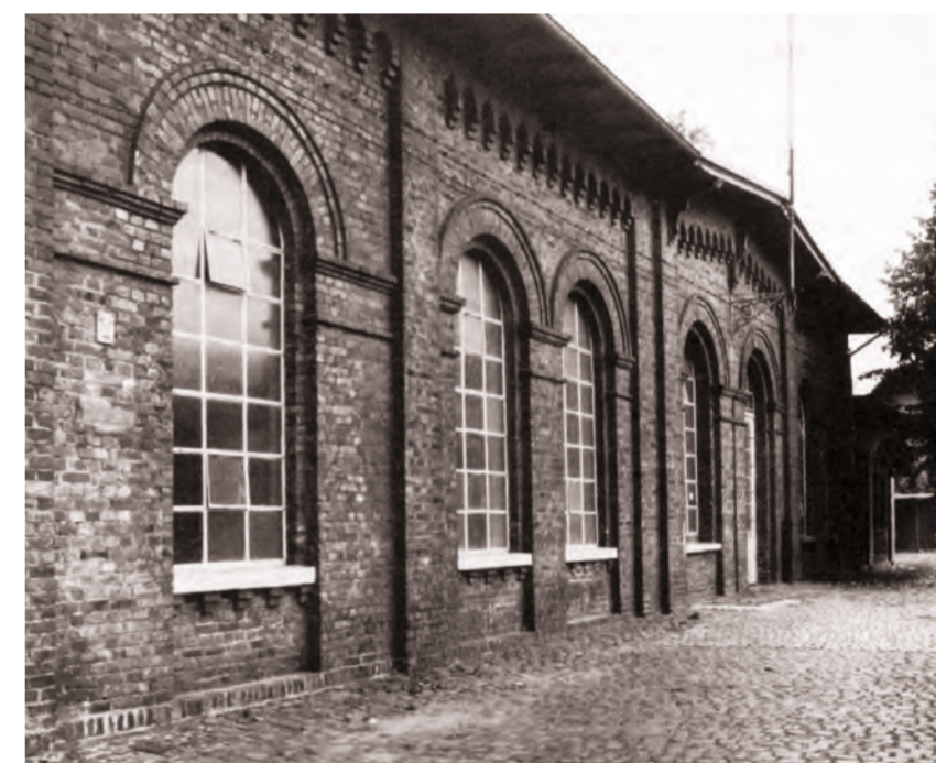
Das Maschinenhaus (Pumpstation) des Wasserwerks von Osten, 1981