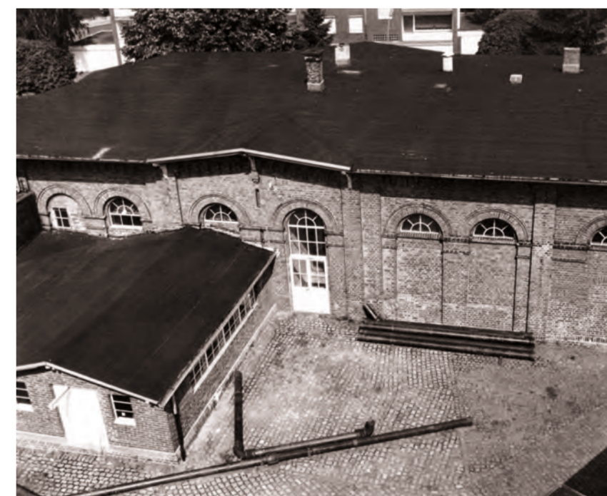
Die siebenachsige Backsteinhalle der Pumpstation kurz vor der Stilllegung, um 1985